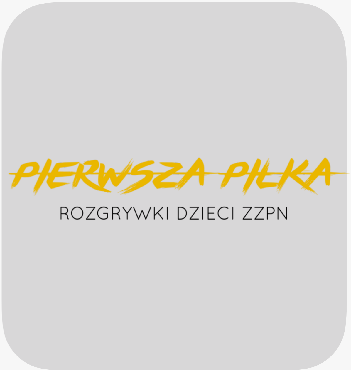
NAZWA ROZGRYWEK DZIECI ZZPN