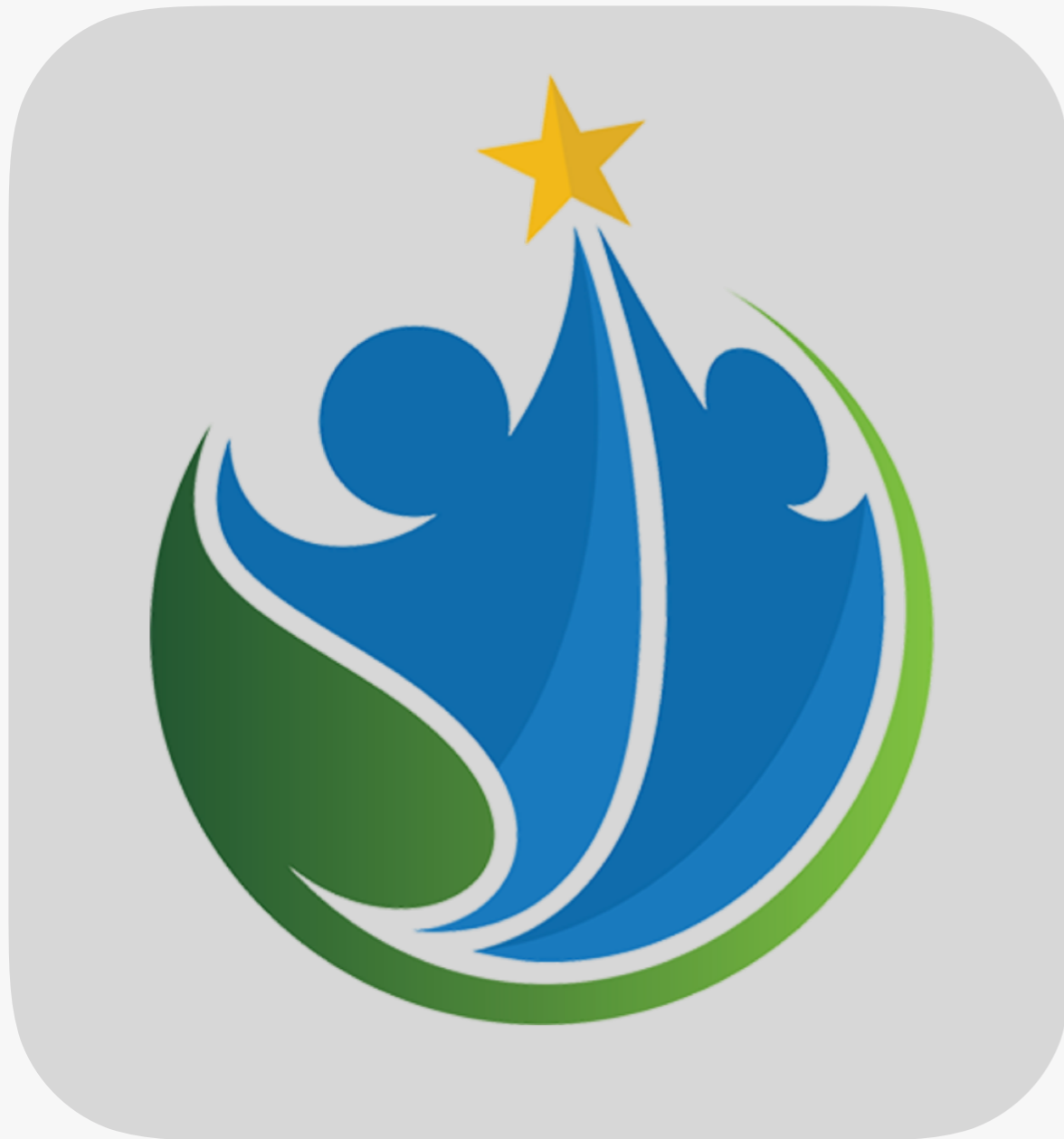
LOGOTYP ROZGRYWEK DZIECI ZZPN